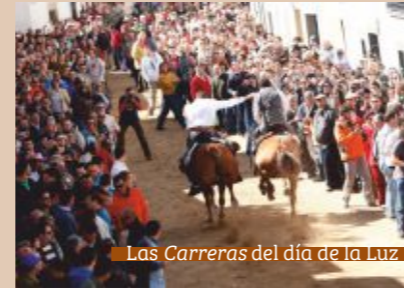
Las Carreras del día de la Luz

La Pedida de la Patatera, en Malpartida de Cáceres, la Fiesta de la Tenca, cada año en una población de la comarca y el Día de la Luz, en Arroyo de la Luz son las tres fiestas declaradas de Interés Turístico Regional. En todas ellas la gente de la comarca se vuelca multitudinariamente y son una ocasión perfecta para disfrutar conociendo su hospitalidad y sus tradiciones.