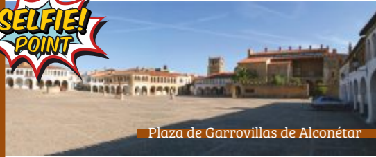
Plaza de Garrovillas de Alconétar