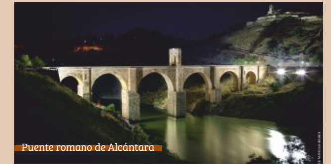
Puente romano de Alcántara

... de Alcántara. La localidad fue sede principal de la Orden homónima y su indestructible puente fue construido durante la época romana.