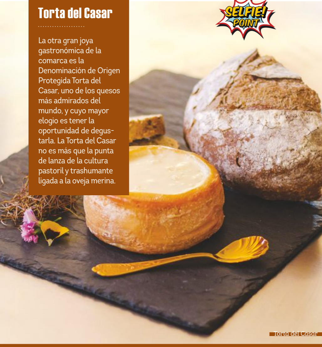
Torta del Casar