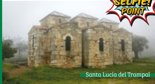
Santa Lucía del Trampal