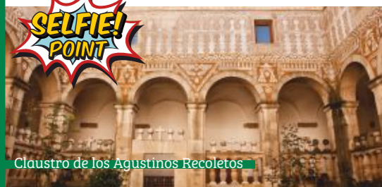
Claustro de los Agustinos Recoletos