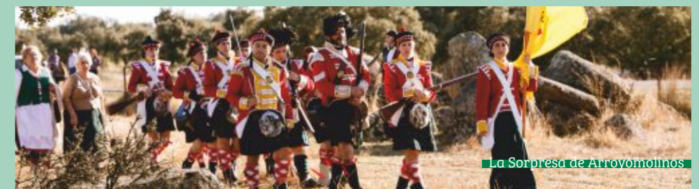
La Sorpresa de Arroyomolinos