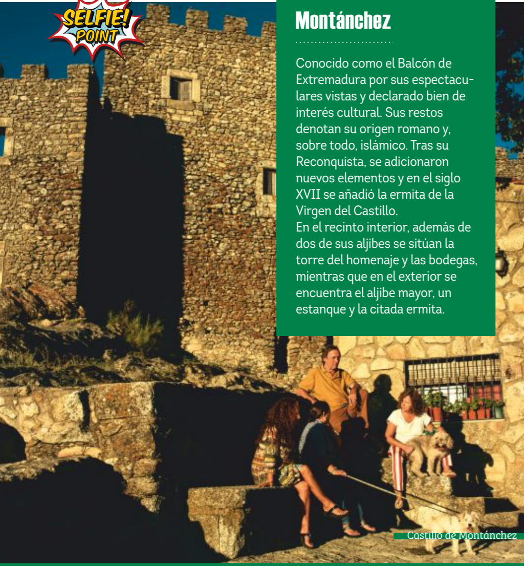
Castillo de Montánchez

Conocido como el Balcón de Extremadura por sus espectaculares vistas y declarado bien de interés cultural. Sus restos denotan su origen romano y, sobre todo, islámico. Tras su Reconquista, se adicionaron nuevos elementos y en el siglo XVII se añadió la ermita de la Virgen del Castillo. En el recinto interior, además de dos de sus aljibes se sitúan la torre del homenaje y las bodegas, mientras que en el exterior se encuentra el aljibe mayor, un estanque y la citada ermita.