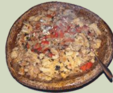
Sopa de peces

Protagonizada especialmente por platos de carne, principalmente la matanza del cerdo (ibérico, claro) y los guisos de caza. Igualmente las sopas de peces de río y el bacalao, sin olvidar dulces y postres con clara influencia portuguesa.