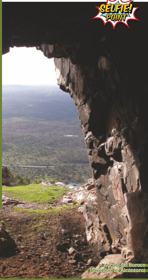
Abrijo del Buraco (Santiago de Alcántara)

Donde las aguas del Tajo unen las fronteras de España y Portugal, se extiende este espacio natural que junto a la sierra de San Pedro albergan la mayor población mundial de águila imperial ibérica y la colonia estable más importante de buitres negros. La embarcación turística Balcón del Tajo es la mejor forma de conocer el corazón del parque natural, con viajes por el río entre las localidades de Cedillo, Herrera de Alcántara, Santiago de Alcántara y la vecina localidad de Castelo Branco.