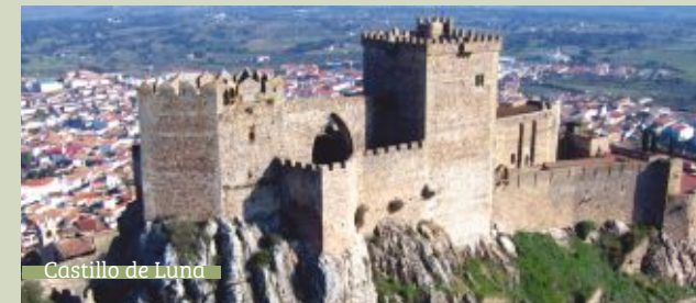
Castillo de Luna