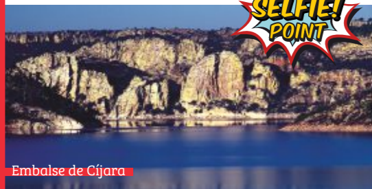
Embalse de Cijara

El agua es uno de los grandes protagonistas de estas tierras recorridas por los ríos Guadiana y Zújar y sus cinco grandes embalses (Cijara, García Sola, Orellana, La Serena y Zújar) que forman la mayor superficie de lagos interiores de España convirtiéndola en la comarca con más kilómetros de costa interior.