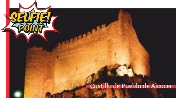
Castillo de Puebla de Alcocer

Pueblos de blancas casas con puertas decoradas con elementos arquitectónicos de filiación renacentista y otros, la mayoría, barroca. Esta arquitectura convive con el estilo mudéjar de muchos de sus edificios y con magníficos castillos como los de Puebla de Alcocer y Herrera del Duque.